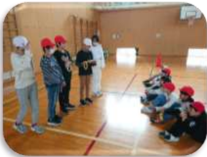
【体育委員会主催のスポーツフェスティバル】