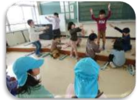
【保育園さんに音楽発表】