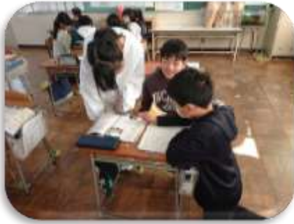
【学習での話し合い】