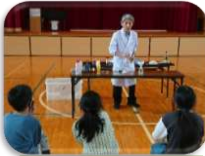
【3年親子 科学学習】 上越科学館館長様と楽しい実験をしました。