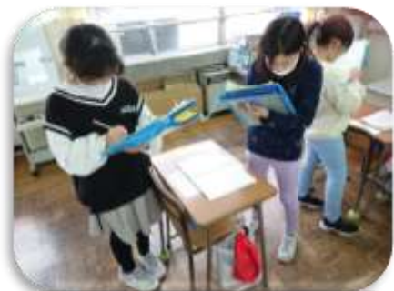
【学習ノート発表会】