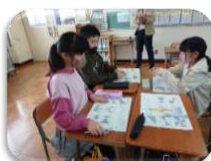
【子どもが主体的に友達とかかわって学ぶ授業づくり】