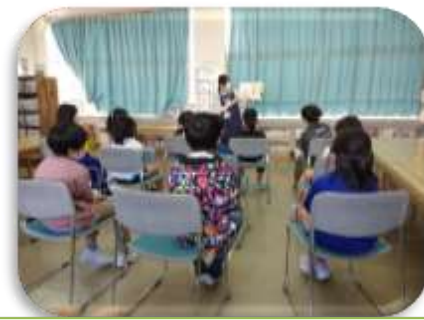
【細山学校司書の読み聞かせ】