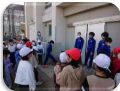
【体育委員会主催の全校おにごっこ】