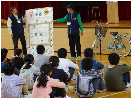
安全な通行の仕方指導の様子

4月27日（金）に交通安全教室が開催されました。市からの指導者を講師とし、保護者ボランティアからのお手伝いをいただきながら、実施しました。1・2年生は三郷小周辺道路での歩行練習、3～6年生は三郷小グラウンドにて自転車実地練習を行い、歩行や自転車運転の安全を確認しました。