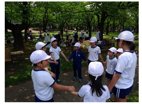
班ごとのレクの様子