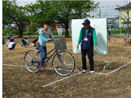
自転車の乗り方指導の様子