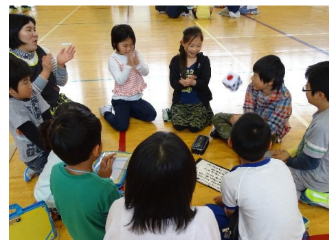
上手な話の聞き方を練習