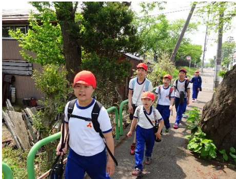
高田公園に向かう様子

5月1日（火）に全校遠足を実施しました。縦割り班ごとに三郷小学校を出発し、高田公園までいきました。高田公園では、オリエンテーリングや縦割り班ごとに考えたレクを行いました。往復12kmの道のりを頑張って往復しました。