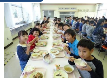
新米「新之助」を堪能