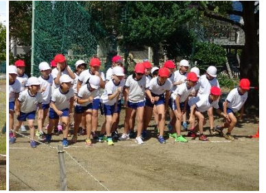
中学年マラソン記録会の様子