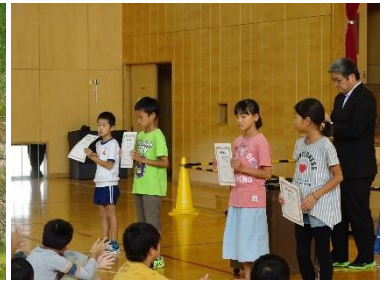
学校記録更新者の表彰の様子