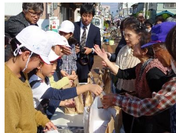
きずな米販売の様子

10月19日(金)に、5年生が総合的な学習で収穫した「きずな米」を朝市にて販売しました。大町小近くで開催されている四・九の市にて、午前10時すぎから販売しましたが、用意した1袋1.5合入りの「きずな米」50袋が、15分もたたないうちに完売!「あっ」という間の出来事でした。販売の後、朝市レストランにて「きずな米ができるまで」の説明を行うとともに、「きずな米」のPR活動を行って来ました。