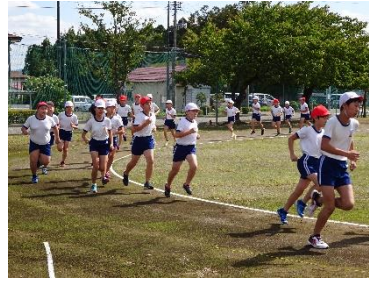
高学年マラソン記録会の様子