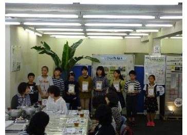
朝市レストランの様子