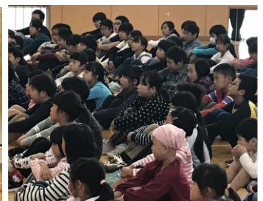
話を聞く児童の様子