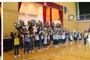
全校発表「銀河鉄道の夜」キッズ・フェスティバルの様子