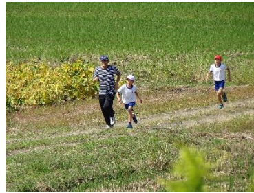
低学年マラソン記録会の様子