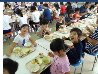
栗ご飯給食の様子

10月5日(金)に栗ご飯、18日(木)に新米「新之助」を給食でいただきました。子どもたちも大喜びで、三郷の秋の味覚を堪能しました。