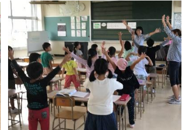
2年生の授業の様子