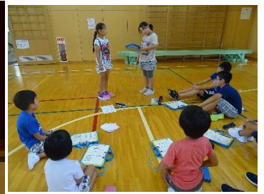
テーマは「やさしいたのみ方」 「たのみ方」の練習の様子