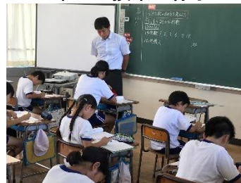
5年生の授業の様子