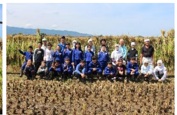
稲刈り後にみんなで