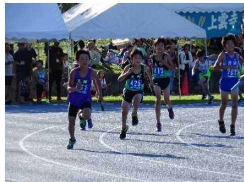
男子 4×100mリレーの様子