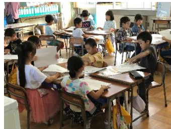
1年生の授業の様子