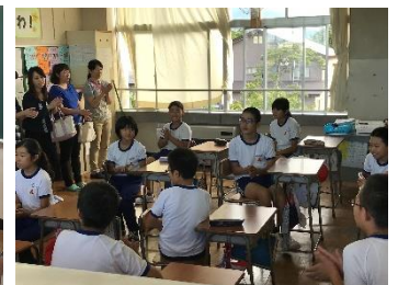
6年生の授業の様子