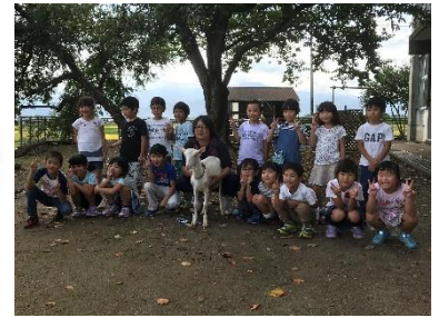
しろとくん歓迎会の様子