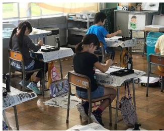
3年生の授業の様子