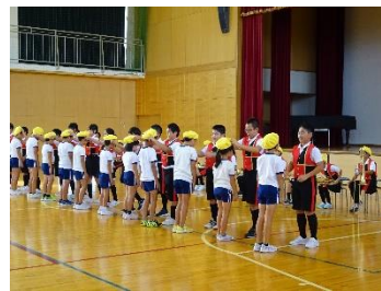
6年生から4年生にベレー帽を引継

5限には、学習参観が行われました。それぞれの学年で、日頃から一生懸命授業に取り組む姿を見ていただきました。多くの保護者の皆様からご来校いただき、ありがとうございました。