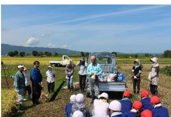
ボランティアの皆さん

9月13日(木)に5年生が稲刈りを行いました。10名のボランティアの皆さんからもご支援いただき、無事に終了することができました。収穫したお米は、後日給食で出される予定です。