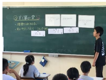
4年生の授業の様子