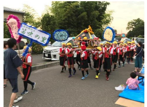
おみこし担ぎの様子