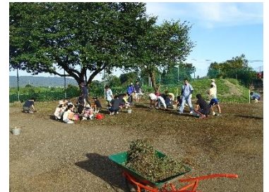
グラウンド整備活動の様子