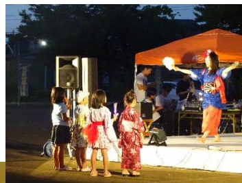
大人の迫力にくぎ付け