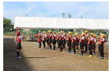
オープニングの様子