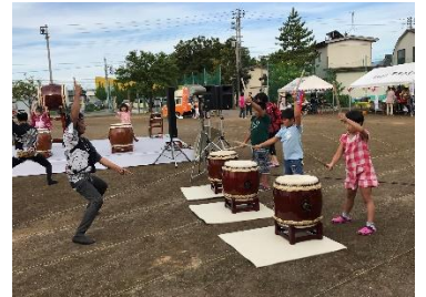
太鼓のワークショップの様子