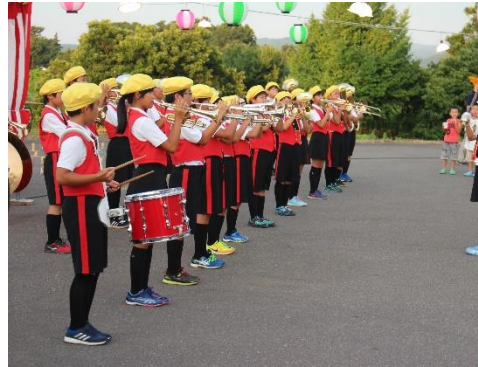
金管バンドの演奏の様子

7月27日(金)に笛吹の里を訪問し、納涼会のオープニングを飾る金管バンド演奏を行いました。地域の皆さんに演奏を聴いていただくだけでなく、おみこしを担いで、納涼会を盛り上げ、ご来場の皆様に元気を感じていただけるように頑張りました。