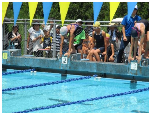
女子 200mリレーの様子

児童は、この水泳大会を目標に、自分で決めた種目について日々練習に励んできました。