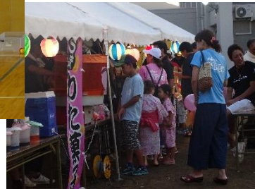
三郷夏祭りの賑わいの様子