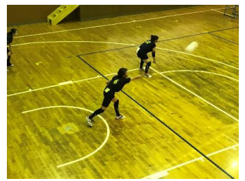
バレーボールの様子