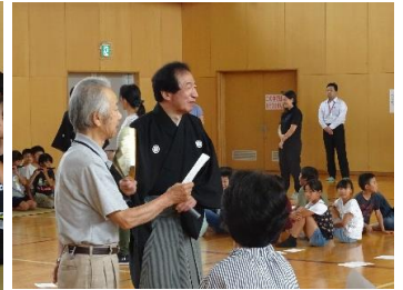
地域の方も謡を練習