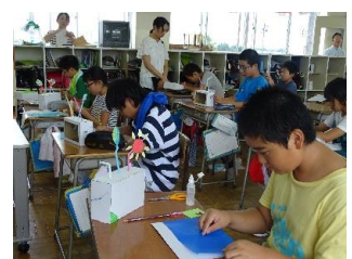
6年生図画工作の授業