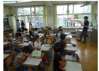
4年生の授業の様子