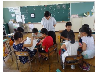
3年生のグループ学習