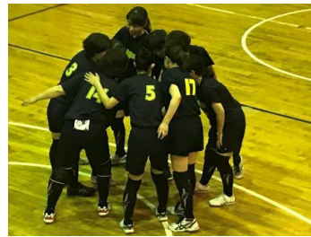
バレーボールの様子