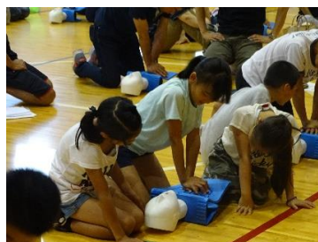
救急法講習会の様子

夏休みのプール開放に向けて、監視をお願いする保護者の方々からご参加いただきました。ありがとうございました。