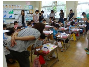
1年生絵の具の使い方授業

また、7月7日未明に発生した「東城町コンビニ強盗事件」に伴う児童の安全確保への対応に際し、下校時の送迎等のご協力、大変ありがとうございました。保護者の皆様だけでなく、地域の皆様にも見守り等でご協力いただきました。