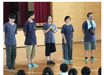
東京演劇アンサンブルの皆さん

本番は4か月後ですが、ワークショップで教えてもらったセリフの発声や振付を忘れないように、練習を重ねていきます。